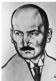
Nikolai Triik. Oskar Lutsu portree. 1928

Lisad nummerdatakse (kui neid on rohkem kui üks) ja vajadusel pealkirjastatakse (tähesuurus 11–12 p) ning joondatakse paremale ( Ctrl + R ): vt käesoleva juhendi lisa. Lisades olevad tabelid, joonised, fotod ja reproduktsioonid pealkirjastatakse või allkirjastatakse nii nagu töös põhiosas. Vaata järgnevat näidet: teose autor, pealkiri, loomisaeg.